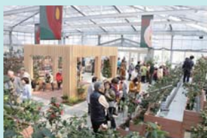
椿好きにはたまらない!