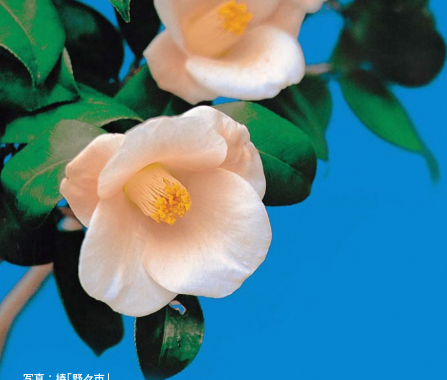
写真：椿「野々市」 特徴：筒咲きで、花弁は淡い朱鷲(とぎ)色