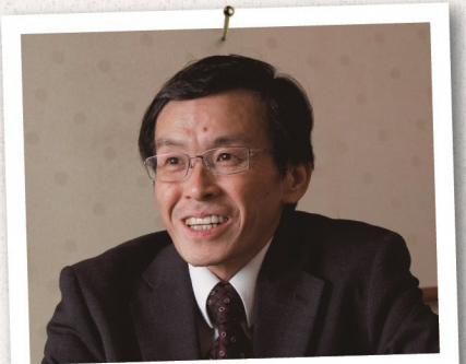
哲学者 岸見 一郎