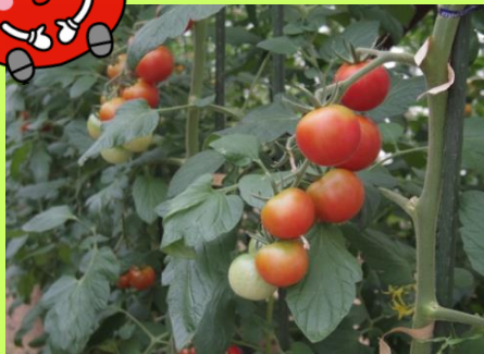
いとうさんから届きました！