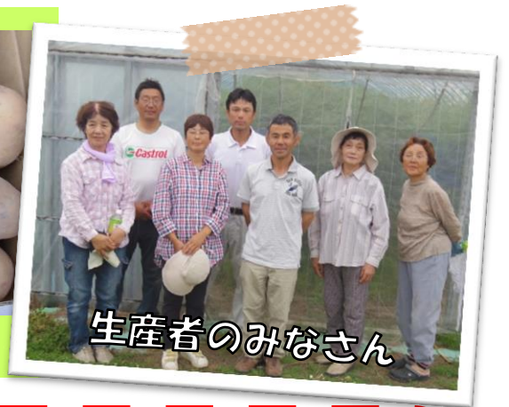
生産者のみなさん

サマーカレーに入っている、 たまご・にんじん・なす・じゃがいも・トマト は、野々市市内の生産者の方々が作ってくれました。生産者の方々が、大切に育てた野菜です。