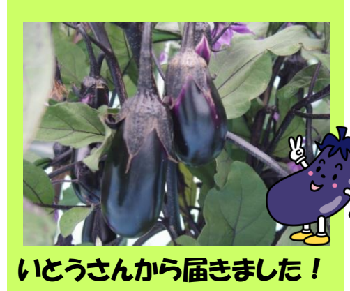
いとうさんから届きました！