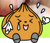
堀内・御経塚産です！