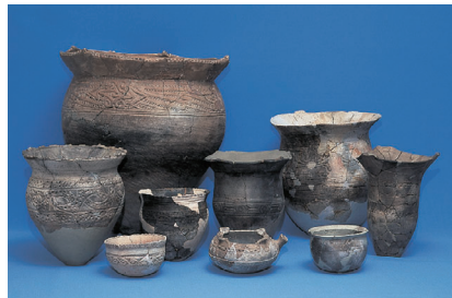
御経塚遺跡出土品 国指定重要文化財