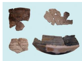
← 市内最古の縄文土器 （4,000年前頃）

4,000年前頃（縄文時代後期前葉後期）から3,800年前頃（縄文 時代後期中葉前半）の時期にかけて、縄文人の暮らしが営まれ ていました。石で囲った炉の跡が見つかります。