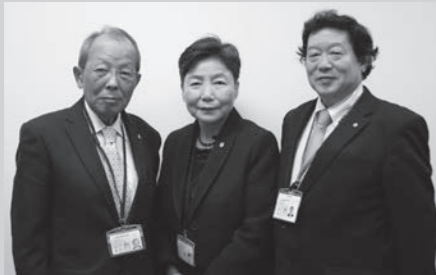
市の行政相談委員の皆さんです。気軽に相談してください!

困りごとがあれば、下記の行政相談委員、石川行政評価事務所が受け付けていますので、気軽に相談ください。(相談は無料。秘密は厳守します。)