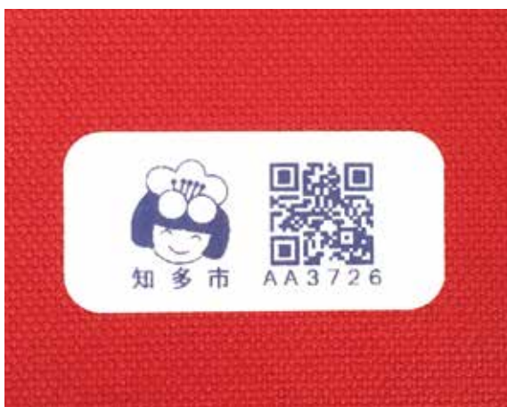
あんしん見守りシール (縦 2.5cm×横 5.0cm)