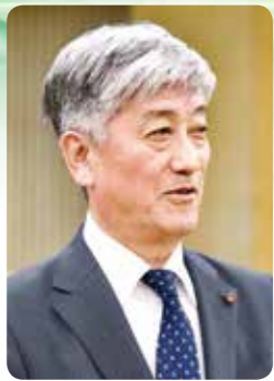
辻 信行 議員