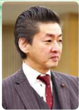
西本 政之 議員