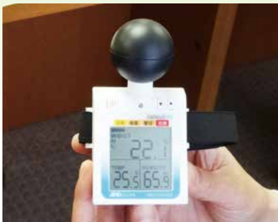
測定器 (暑さ指数を測定)

(※1) 暑さ指数とは・・・気温・湿度・輻射熱から算定され、熱中症の危険度を判断する目安として国際的に用いられています。測定器を用いて比較的簡単に測定ができます。