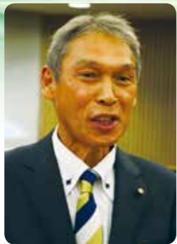
朝倉 雅三 議員