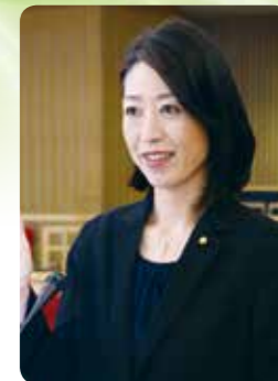
梅野 智恵子 議員