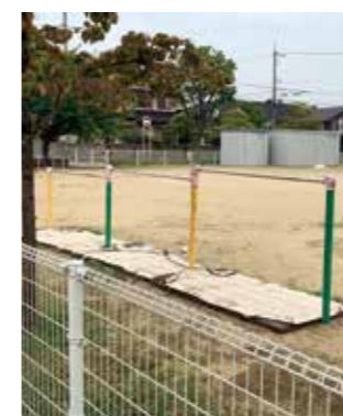
現在の保育園の遊具

5つのうち3つが撤去され、現在はブランコと鉄棒しか遊べる遊具がない状態が1年ほど続いている。園庭遊具設置について市の方針は。 A 健康福祉部長 ● 園庭の滑り台やブランコ、ジャンブルジムなどの固定遊具の存在は子供たちにとっても魅力的であり、心身の発達にも寄与するものであると考えていることから、園の保育方針を踏まえ、その必要性や安全性を十分考慮し、現場の保育士とともに検討してまいります。 A 市長 ● 園の方針を踏まえて、それぞれの園の園庭の広さや子供の発達状況に応じて、要望を把握しながら、その必要性を十分精査した上で検討する。何より子供達の笑顔が溢れ、野々市市の公立保育園の理念でもある「心身ともにたくましい子」を育む施設の整備、これに努めてまいります。