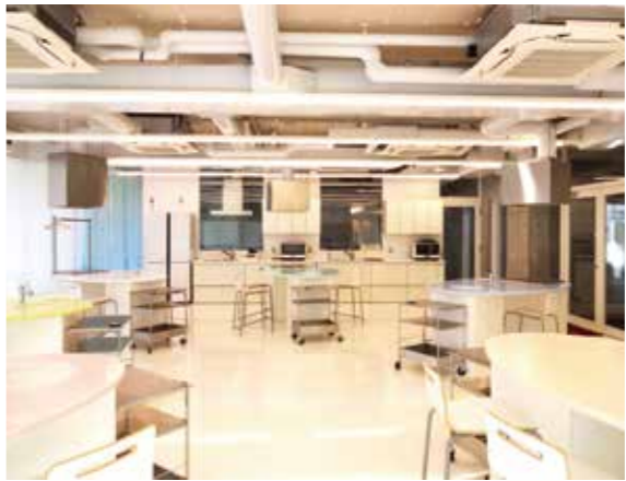
市民学習センターのキッチンスタジオ

Q 先般の台風15号の被害を受けて、本市における業務継続計画の見直しの必要性を感じているのか問う。 A 大規模な災害が予想される場合は、事前に対応を検討しており、庁舎などの公共施設につ