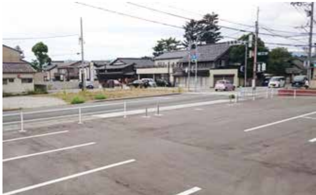
郷土資料館駐車場(手前)と新たに購入する土地(道路向こう側の雑草地)

A 大倉外科医院跡地の使用目的については、旧北国街道における説明看板や観光客のための公衆トイレの設置、また、この跡地が交差点に近い土地であることから、渋