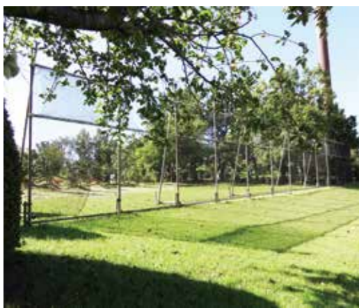
中央公園防風ネット

A 防風ネットと仮設フェンスは椿の苗木の養生を目的として、平成28年、椿の植栽の際に養生を目的として設置した。今のところ撤去の予定はないが、椿の育成状況を確認し、撤去時期を考えていきたい。