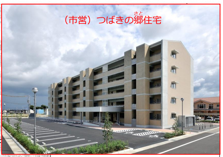
(市営) つばきの郷住宅

所在地：野々市市二日市五丁目 333 番地 敷地面積：3,134.63㎡ 建築面積：821.47㎡ 延床面積：3,183.88㎡ 構造：鉄筋コンクリート造5階建て 主要室・戸数：1LDK (10戸、うち車いす用1戸) 2LDK (30戸、うち車いす用3戸) [平成24年9月竣工]