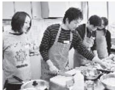
プレパパママクラス

毎月1回、3回シリーズで行われている「プレパパママクラス」第2回はパパでもできる簡単クッキング。手なれたパパや買ったばかりのエプロンのパパも。子どもやママのためにあなたも作ってみませんか？