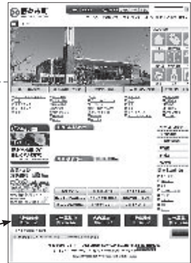
<トップ画面イメージ>

町では、地域経済の活性化、住民サービスの向上を図るため、広報、そして新たに町ホームページにおいて有料広告を掲載します。会社やお店のPRにご活用ください。