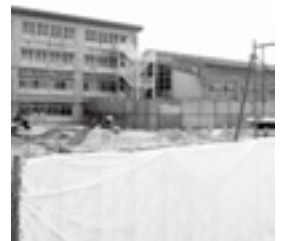
5月には仮校舎の建設が始まっています