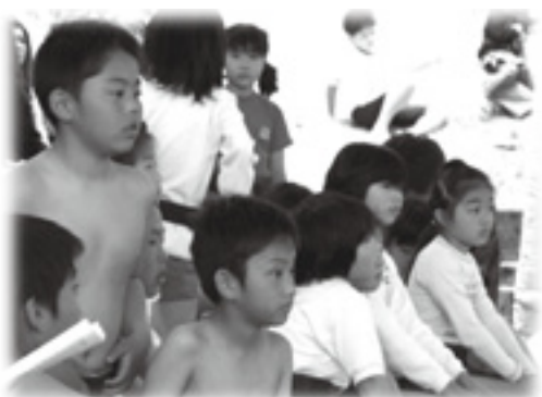
「あいつ強いな～」友達の取り組みを見ながら出番待ち

5月16日(土)、町相撲場で第13回小学生すもう大会が開かれました。肌寒い天気でしたが、183人の小学生力士は元氣いっぱいに取り組みを行いました。大会では、小さな身体を利用して相手の懐にもぐりこみ、見事に勝利する場面も見られ、会場は大きな歓声に包まれました。