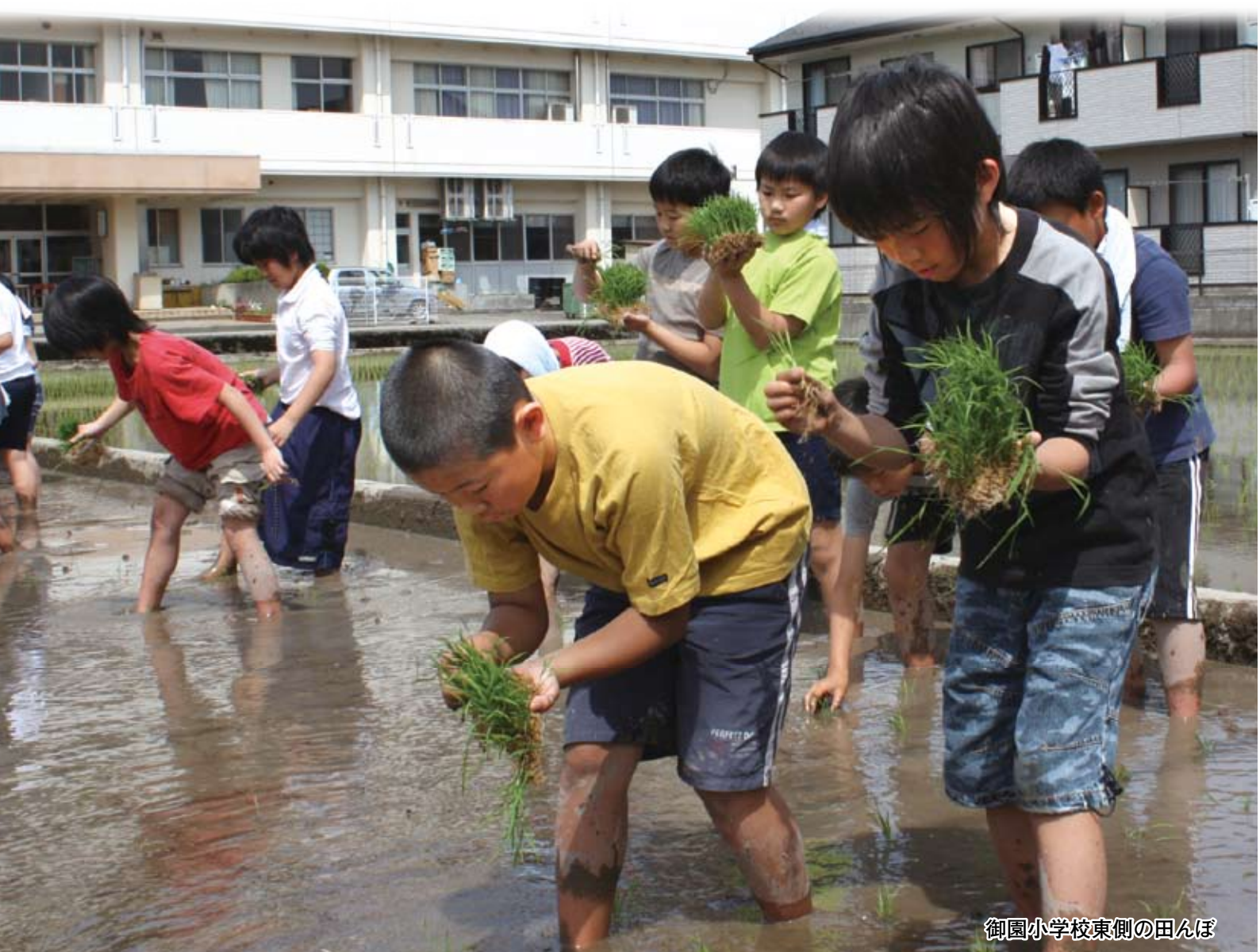
御園小学校東側の田んぼ