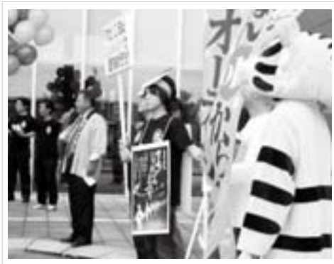
開催前には役場前や町内ショッピングセンターでPRイベントを行いました