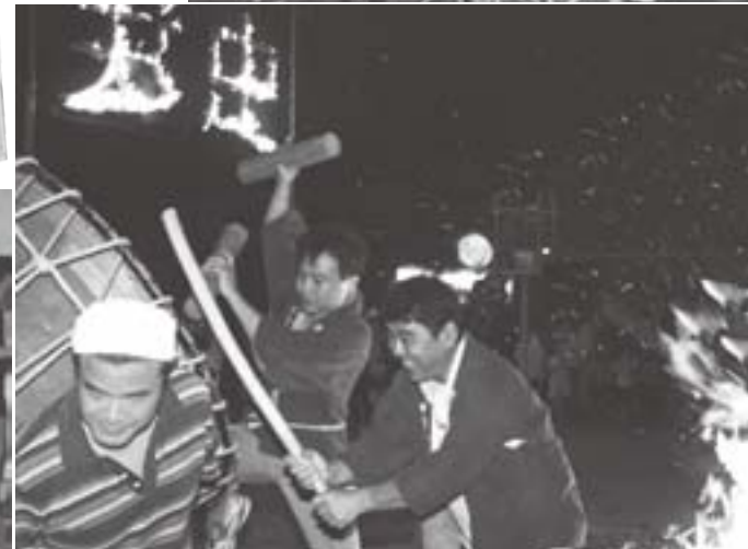
右上、御経塚。左上、富奥地区。左中、富奥地区で今年製作された虫送り手ぬぐい。下2枚、押野。