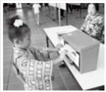
まつりで詠む一句