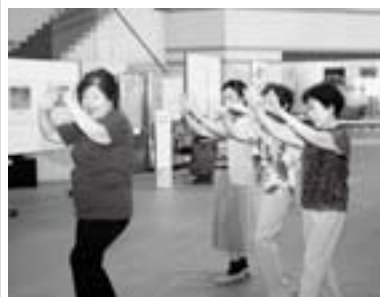
2日間とも開催。じょんから踊り講習会