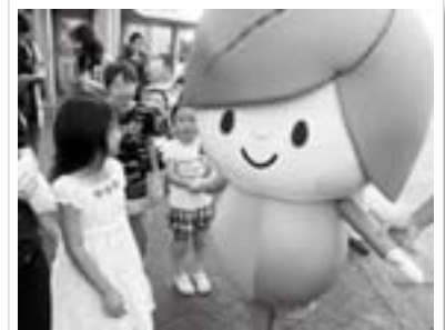
来年のねんりんピックをPR「ゆーりん」