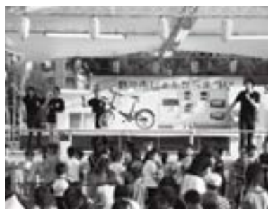
何が当たるか? お楽しみ抽選会