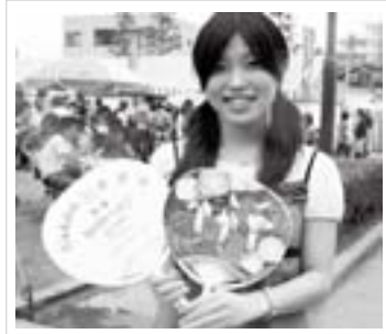
今年も関西野々市会から うちわが寄贈されました