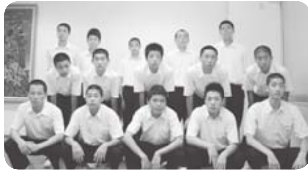
布水中学校バスケットボール部