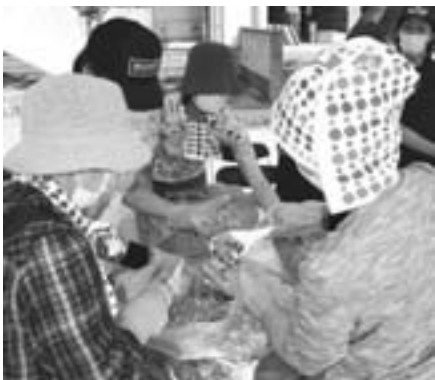
↑ アルファ米の炊き出し訓練

昨年に引き続き、被災地では最重要課題の一つとなる災害ボランティアセンター運営の訓練も行われました。県災害ボランティア協会と町社会福祉協議会が協力し、町内会の代表者とボランティア登録や活動の流れを訓練し、スムーズな受け入れ態勢作りを学びました。