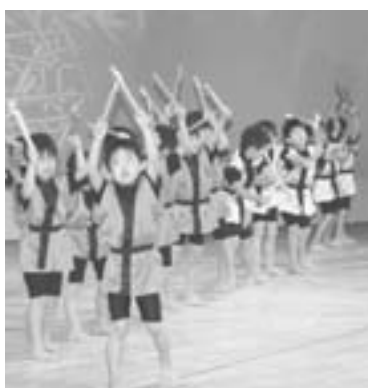
中央保育園年長児の発表