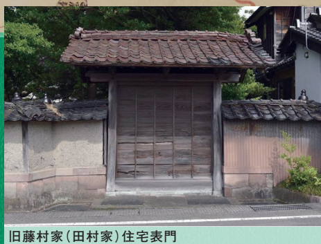
旧藤村家(田村家)住宅表門