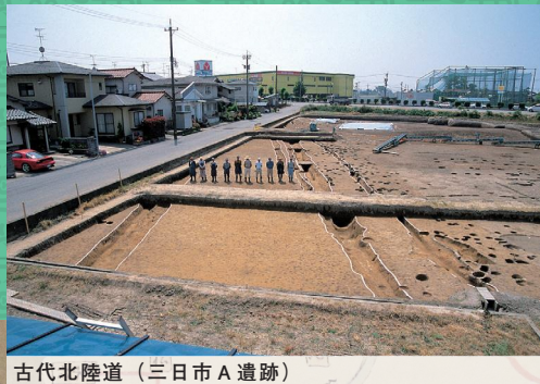
古代北陸道（三日市A遺跡）

野々市市はかつてより、交通のかなめとして人や物が往来し、栄えました 「旅」をテーマに、古代から近代までの記録や歴史を紹介します