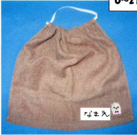
(約 35 x 35 cm)

11-フタホレを使用します。 上部にゴムを通し お子さんの首のサイズに 合わせて下さい。