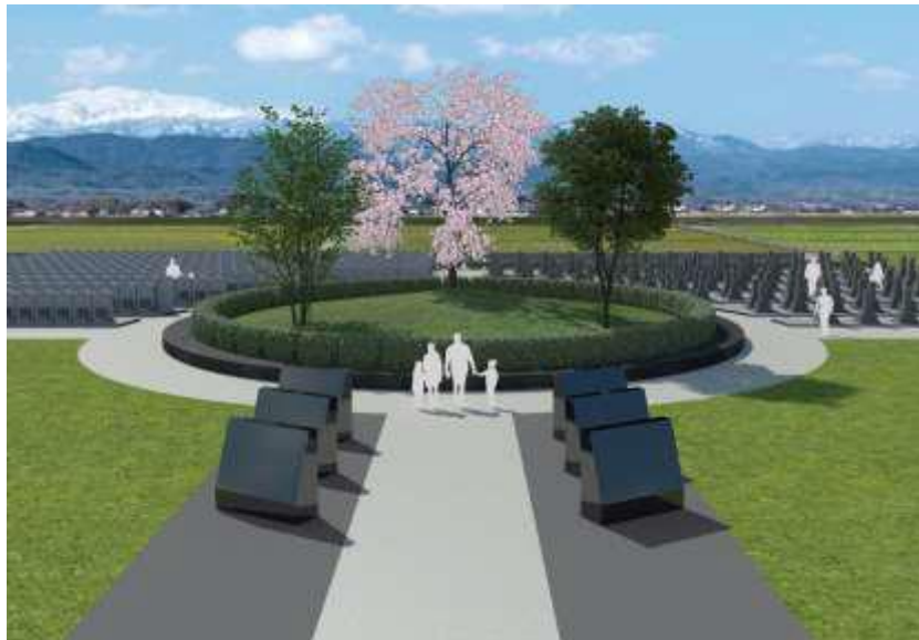
市営墓地公園（樹林型合葬墓）予定図