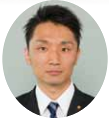
い かがわ かずのぶ 五十川 員中 扇が丘 教育福祉 予算決算