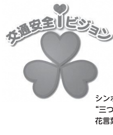
シンボルマーク “三つ葉のクローバー” 花言葉：「愛」「希望」「信頼」 をイメージ

♡ i 相手に伝えよう、交通安全ちょっといい話 交通安全ほっとストーリー 交通安全ちょっといい話を、皆で共有しよう