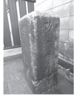
野々市村の道路元標