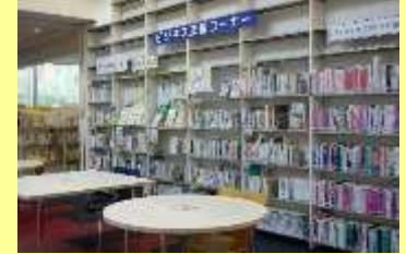
ビジネス支援図書