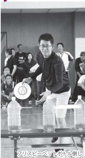
フリスビーペットボトル倒し