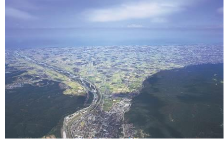
手取川扇状地航空写真