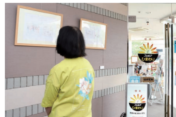
喫茶フォルテひまわりも、(株)アルバの就労支援施設の一つです。

4月29日(金・祝)～5月31日(火)、放課後等デイサービスを利用する子どもたちの作品展が喫茶フォルテひまわりで開催されました。これは、障害福祉サービスを提供する(株)アルバが「子どもたちが楽しんで描いた作品を見てもらう機会を作りたい」と企画。4人の子どもたちの作品6点と多機能型支援施設ヒラソルこづの皆さんが作った合同作品1点を喫茶やフォルテロビーに展示し、来場者を楽しませました。今後も不定期で、サービス利用者の作品展示を予定しています。