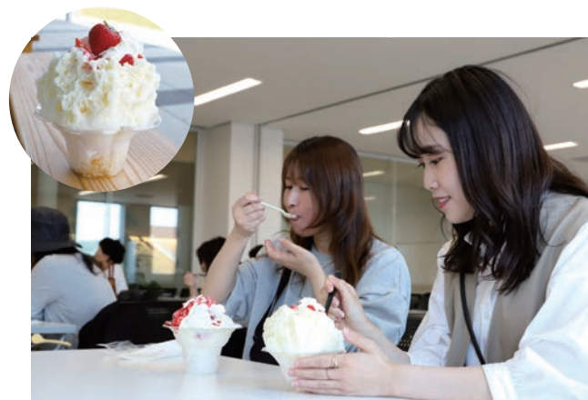
当日は天候に恵まれ気温が高く、絶好のかき氷日和！