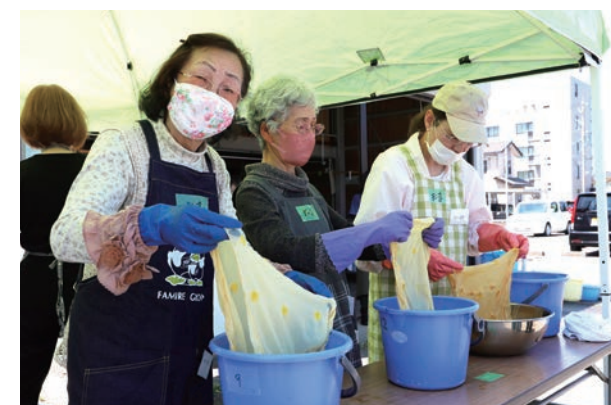
黄色の染料として使っているのは、なんと玉ネギ！

5月18日(水)、市商工会駐車場で草木染め体験が開催され、市民13人が参加しました。“草木染め”は自然の植物や野菜などを原料とした染色技法のことで、今回講師を務めた市商工会女性部が作る「ののいち草木染」は野々市ブランドの認定も受けた一品です。参加者は黄色、オレンジ、ローズピンクの3色から好きな色を選び、絹100%のスカーフを染色していきます。思い通りの色を目指して作業を重ね、「きれいな色やね！」と話しながら染め上げていました。