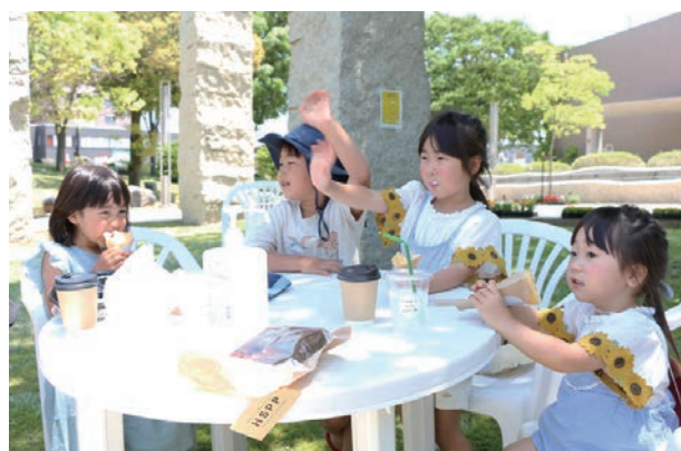
キッチンカーのクレープを頬張り子どもたちもイベント満喫中！

5月28日(土)・29日(日)にJR野々市駅北口広場で、御経塚にぎわいマルシェが開催されました。御経塚、二日市町、長池町の住民15人で組織する御経塚まちづくり会が、駅周辺の魅力向上を考える社会実験として企画しました。会場周辺の人流調査や来場者へのアンケートも行い、結果を今後のまちづくりに生かしていくそうです。色とりどりの花で飾られた会場には、おしゃれなキッチンカーあり、多彩なコンサートなどの催しもありで、たくさんの笑顔が溢れる空間となりました。