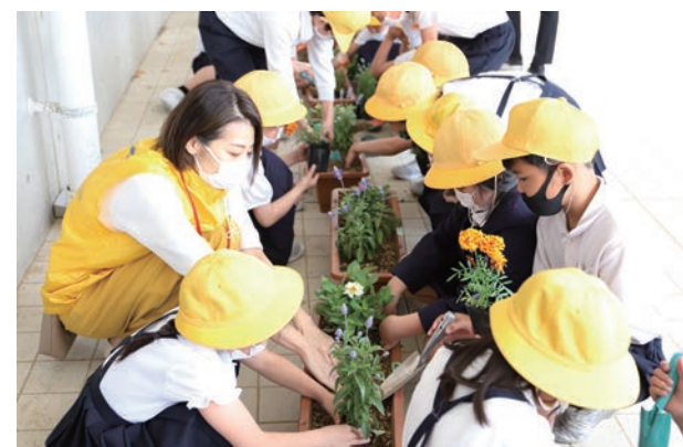
子どもたちと共に、元気に育ってくれるといいですね。