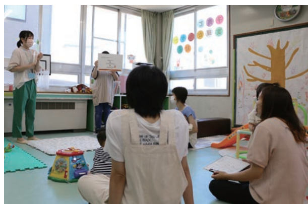
7月は14日(木)と21日(木)に開催予定！（要事前申し込み）

6月1日(水)、野々市小学校で「人権の花運動」が行われました。この運動は、子どもたちが互いに協力して花を育てることによって、命の尊さを実感し、豊かな心を育むことを目的としたもので、毎年、人権擁護委員の協力のもと行われています。この日は、3年生176人が、人権の大切さを学んだ後、マリーゴールドなどの花苗をプランターに植え替えました。どのプランターにもきれいな花々が植えられ、早速、見ている人の気持ちを優しくしてくれました。