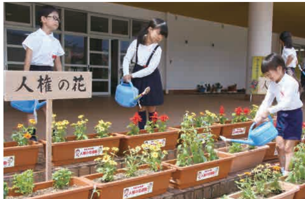
もらった花苗は、みんなで協力してプランターに植えました。