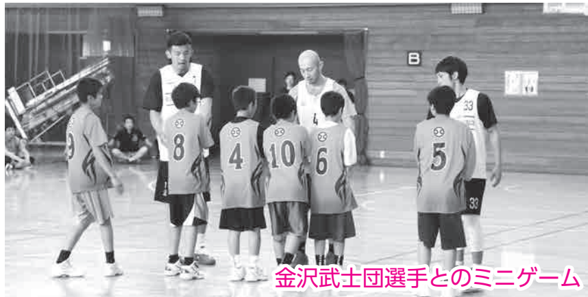
金沢武士団選手とのミニゲーム