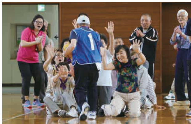
置き換え競争のアンカーを笑顔で迎え入れる参加者