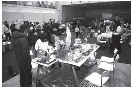
CoCo ARC（学びの杜のいち カレード）