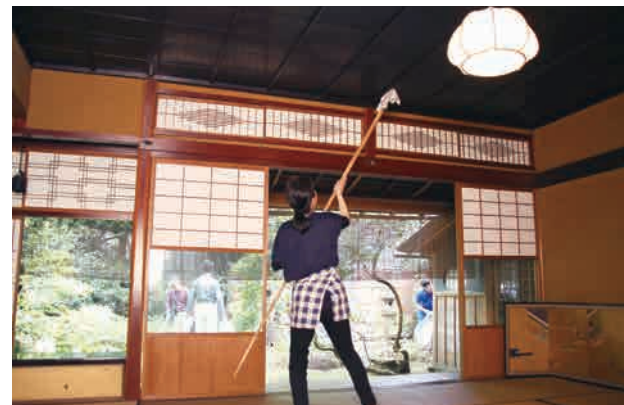
第2弾は喜多家での風鈴作り。8月4日(土)に開催予定です。

5月26日(土)、市観光物産協会が主催した重要文化財喜多家住宅のお掃除イベントが開催されました。北国街道にぎわい創出プロジェクトの一環として開かれたもので、当日はののいち里まち倶楽部のメンバーを含めて31人が清掃活動を行いました。掃除後には出し物として、かなざわ紙芝居倶楽部による紙芝居「滝の白糸」などが披露され、ユーモアを交えた軽快なトークが場を和ませていました。普段は体験できない歴史的建造物での作業は、貴重な思い出となったようです。