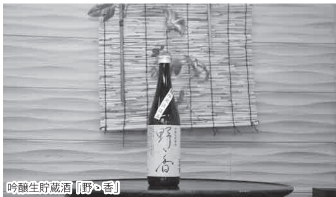
吟醸生貯蔵酒「野々香」

また、中村酒造(株)の製造する大吟醸日榮が平成30年全国新酒鑑評会で金賞を受賞。全国から800点以上の吟醸酒が集う鑑評会で高い評価を受けました。