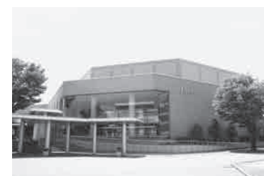
文化会館フォルテ