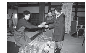
ヤーコンCAFE（郷土資料館）

市 は、市民協働のまちづくりを推進しており、これまでも市民の皆さんと一緒に数々のにぎわいづくりに取り組んできました。その中には、学びの杜のいち カレードを会場とした音楽・芸術のワークショップイベント「CoCo ARC（ココアーク）」、郷土資料館の「六日町かふえ」でヤーコンの加工健康食品を販売する「北国街道ヤーコンCAFE」など、野々市中央地区で行うイベントも多数展開されています。 本町二・三丁目の旧北国街道を舞台に平成23年から毎年行われている「北国街道野々市の市」は、「野々市」という地名の由来にもなっている、かつての「市」のにぎわいを北国街道で再現したい」という思いから始まった市民発信のイベントで、飲食や展示、劇など多彩な出し物を楽しむことができます。 また、これまでに『北国街道にぎわい創出プロジェクト』の一環として、「まち・ひと・にぎわいセミナー」や「喜多家おそうじ作戦」を実施しました。 これからも市民と行政が協力して取り組み、野々市中央地区の魅力を最大限に引き出し、ヒトとモノが交流する、かつての「市」のようなにぎわいを取り戻していきます。