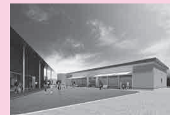
地域中心交流拠点施設の完成予想図