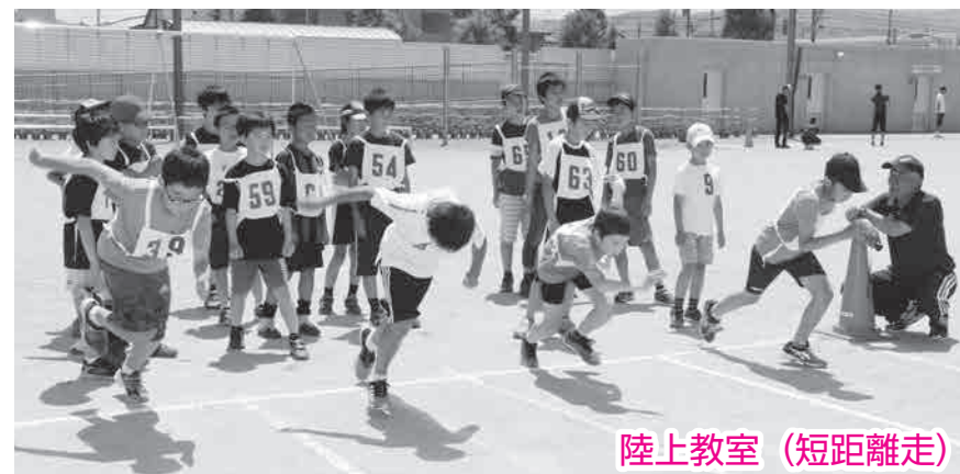
陸上教室（短距離走）