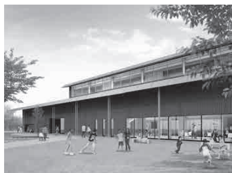
地域中心交流拠点施設の完成予想図

北 国街道にぎわい創出プロジェクトでは、野々市中央地区でのイベントの開催に加え、まちづくりに取り組む人材の育成、特産品の開発研究や観光振興、古民家再生などを進めてヒトづくり・モノづくり・コトづくりに取り組み、未来に伝えるべき地域と地域資源を生かした「持続可能な野々市」の創出を目指します。