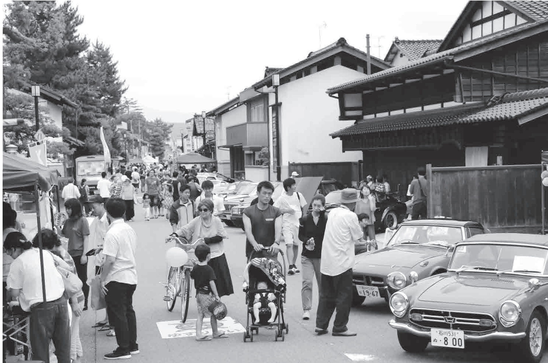
北国街道野々市の市（北国街道）

野々市中央地区での交流が盛んになり、そこににぎわいが市内全域に広がってほしいですね。