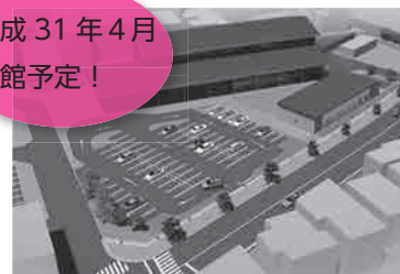
地域中心交流拠点施設