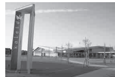
学びの杜のいち カレード