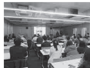
まち・ひと・にぎわいセミナー （学びの杜のいち カレード）