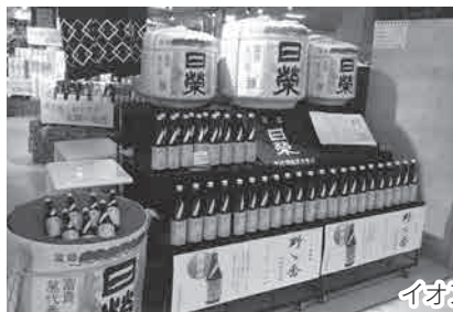
イオン御経塚店での販売の様子