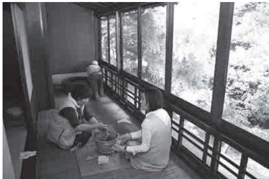
喜多家おそうじ作戦（喜多家住宅）