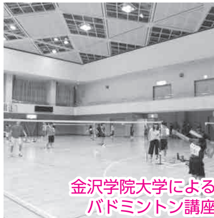
金沢学院大学による バドミントン講座