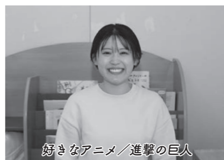
好きなアニメ/進撃の巨人