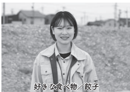
好きな食べ物/餃子