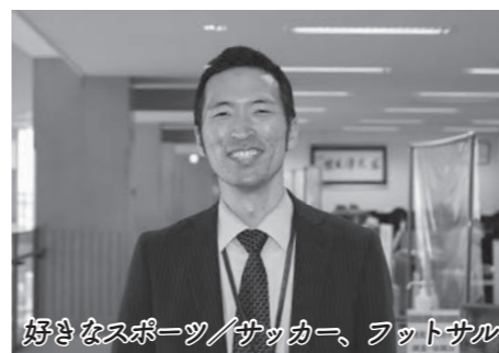
好きなスポーツ/サッカー、フットサル