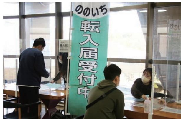
教科書などの購入後に、学校で転入手続きをする新生入生たち。