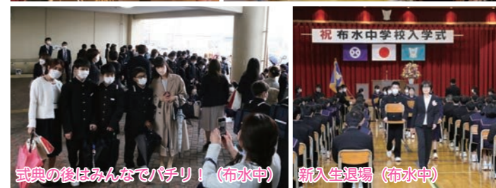
式典の後はみんなでパチリ!(布水中)