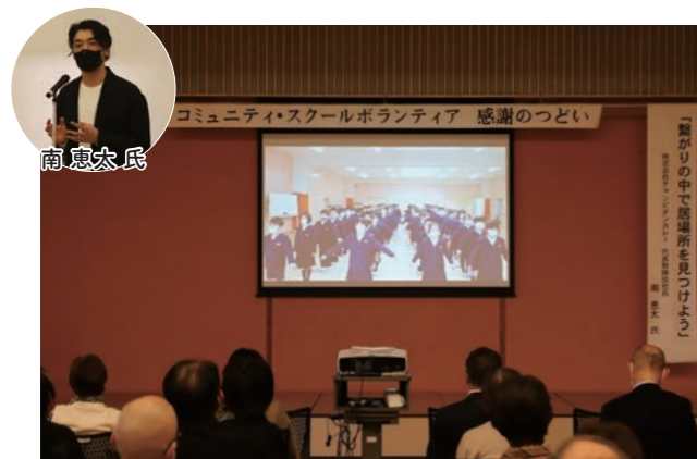
子どもたちから感謝のビデオメッセージ。思わず笑みがこぼれます。