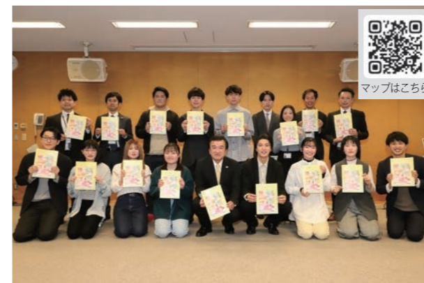
完成したマップはSDGs関連イベントなどで配布しています。