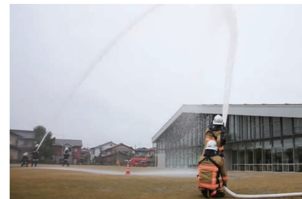
雨が降りしきる中、迅速に放水が行われました。

3月26日(日)、学びの杜ののいちカレードで火災防ぎょ訓練が行われました。この訓練は、火災が発生しやすい時季を迎えるにあたり、防火意識を高めることなどを目的に毎年開催しています。カレードから出火、燃焼拡大の恐れがあるという想定で、施設職員が通報、消防署と消防団員約100人が連携し消火活動にあたりました。訓練終了後には、新入団員の紹介もありました。市では消防団員を募集しています。興味のある人は総務課 ☎ 227-6051) まで問い合わせください。