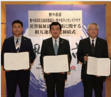
協定締結式（5月9日(火)実施）

市と市社会福祉協議会および野々市ライオンズクラブは、大規模災害発生時の被災地域における福祉・ボランティア活動に対する人的な支援、必要な物品・資機材などの提供または貸与、災害ボランティアセンターが行う救援活動への支援に関する協定を締結しました。