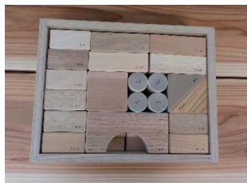
（積み木セット（広葉樹））

（配布施設）市立保育園5園、子育て支援センター、保健センター、学びの杜のいちカレード、にぎわいの里のいちカミーノ