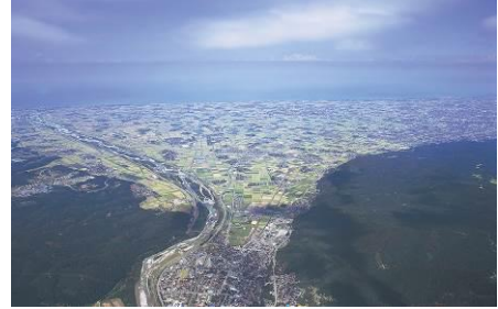
手取川扇状地航空写真