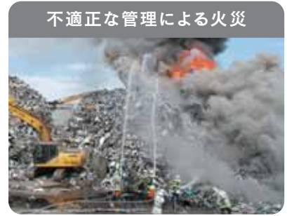
不適正な管理による火災

廃家電は電池やプラスチックを含むため、発火・延焼の危険性があり、不適正な管理による火災が発生しています。