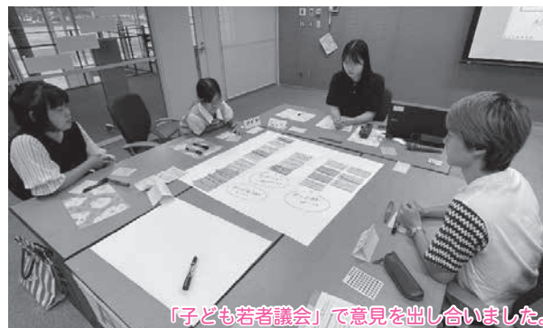
「子ども若者議会」で意見を出し合いました。

発表したアイデアをもとに提言書を作成し、10 月には子ども若者議会の議長と副議長が市議会の議長と副議長に手渡しました。(提言の様子は 29 ページ)