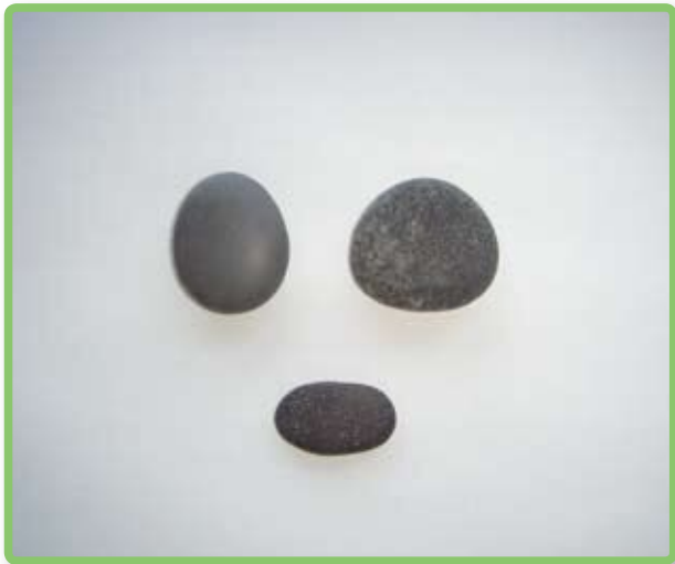
碁石（徳用クヤダ遺跡出土）