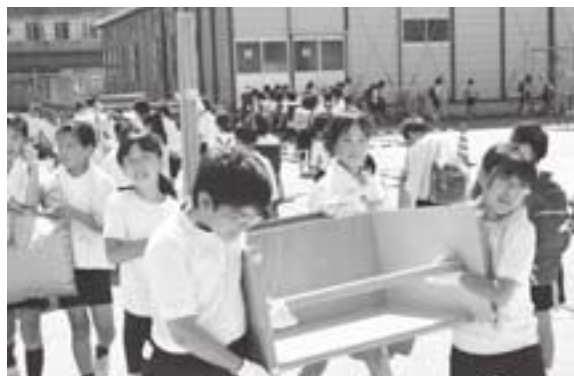
▲新校舎に胸躍らせている子どもたち