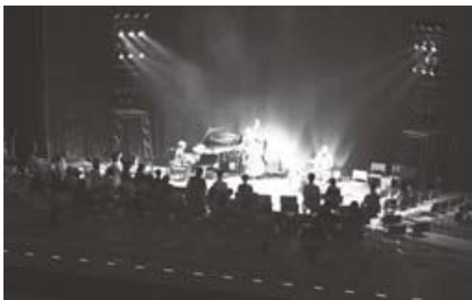
ステージ上で演奏者を囲むように作られた客席。肌で音楽を感じられます。