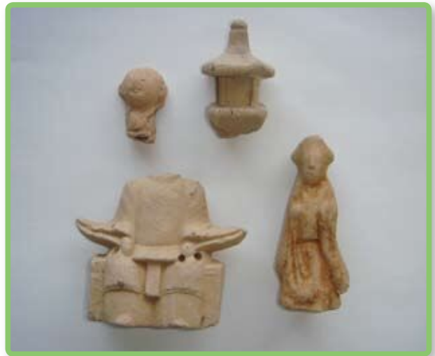
土人形（三日市 A 遺跡出土）