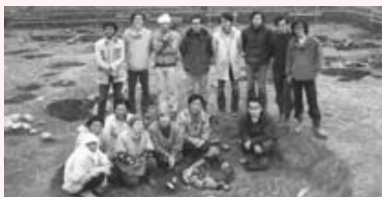
▲昭和50年の発掘現場（高本さんは後列右から2番目）

建っていますが、発掘された12本の柱（出入口6本含む）の跡から、どう立体的に作り上げるか、とても悩みました。静岡県の登呂遺跡や富山県の不動堂遺跡など、各地の復元住居を見て周り、今の形になりました。しかし、自分だったら当時は全然違う形だったかもしれません。想像しながら見るのも楽しいですね。 御経塚遺跡の国指定、そして史跡公園としての整備には、いろんな人に力を貸してもらいました。地元による理解者がいて、それに応える行政があつて、応援し指導してくださる外部の専門家がいます。このつながりが、町の歴史を動かしたのです。 今回の重要文化財指定は、継続して町が御経塚遺跡の保存管理に力を入れてきた結果であり、これからは御経塚への熱い思いが紡がれていってほしいです。