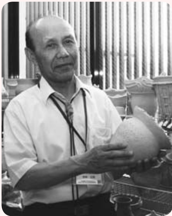
御経塚縄文の会 会長

御経塚遺跡が国指定史跡となって33年。当時から遺跡を見守り続ける2人に話を伺いました。