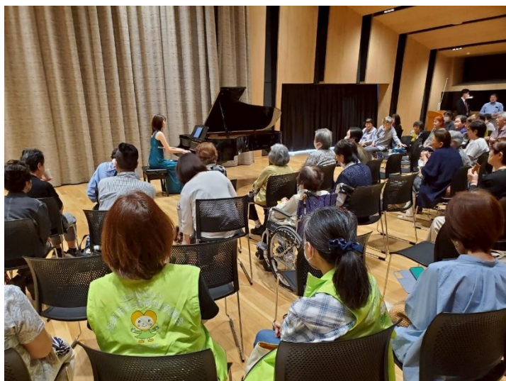
R7.5.20 カミーノホール 『ふらっとほわっとピアノコンサート』