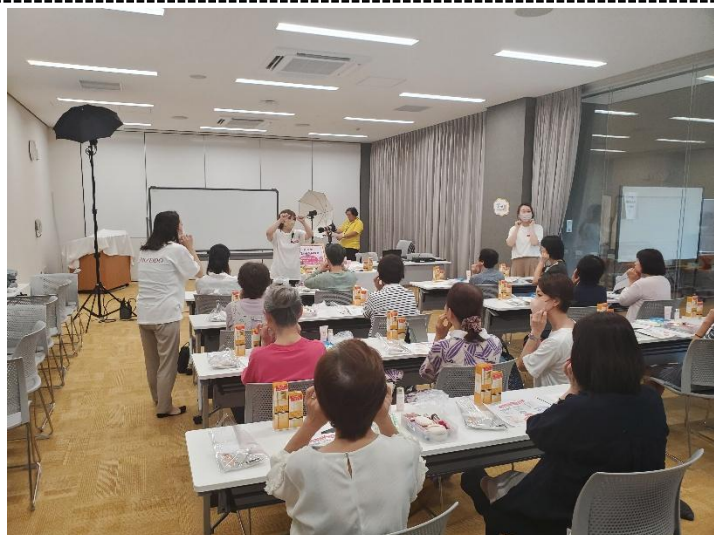
R6.7.30 カミーノ視聴覚室 『いきいき美容教室』