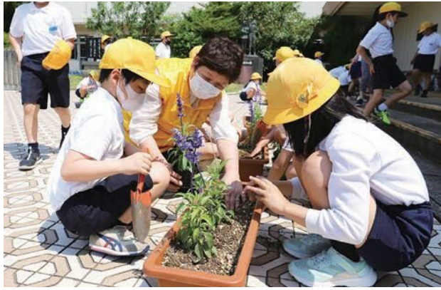
元気に育つことを願って、一つ一つ丁寧に植えていました。