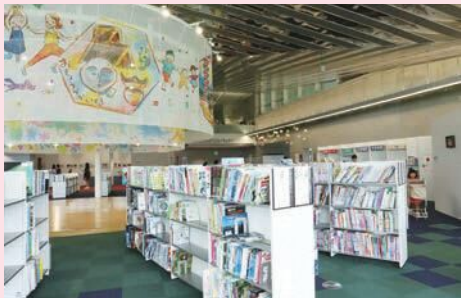
児童書のコーナーは大きなパオが目印

文部科学大臣表彰「令和3年度子供の読書活動優秀実践図書館」に学びの杜のいち カレードが選ばれました。この賞は、子供が読書に親しむための優れた取り組みを行っている図書館に与えられるものです。ブックスタートや市内の小・中・高校との連携事業など、子供が本と出会い、楽しめる取り組みが評価されました。