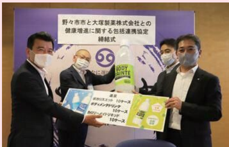
大塚製薬株式会社