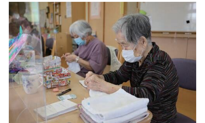
昨年度はぞうきん 607 枚、ウエス 1,580 枚が集まりました。

ちょいボラでは“自宅でできるボランティア”として、各家庭からぞうきんやウエスを集めて福祉施設に届けています。また、タオルが寄付された場合は、ボランティアの皆さんがぞうきんにしています。6 月 17 日(木)には、いきがいセンターの利用者 7 人が慣れた手つきでタオル切って、次々とぞうきんを縫っていました。ぞうきんとウエスは 7、8 月も市社会福祉協議会で集めています。自宅でできるボランティアに、あなたも参加してみませんか？