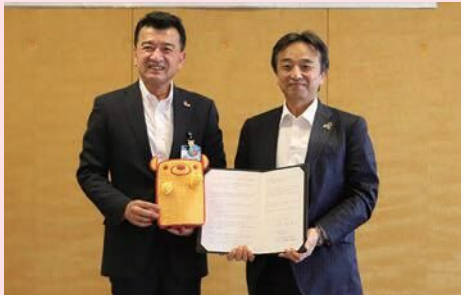
明治安田生命保険相互会社

市民の皆さんの健康増進に向けて、明治安田生命保険相互会社および大塚製薬株式会社と連携協定を締結しました。今後はがんや熱中症対策といった健康に関するセミナーやイベントの開催など、健康な地域づくりに向けた取り組みを連携して行います。