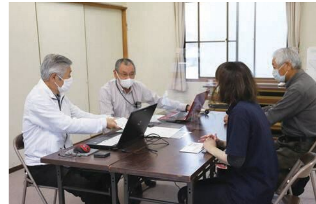
丸木町会の様子。この日は代行した全員分の予約が取れました。