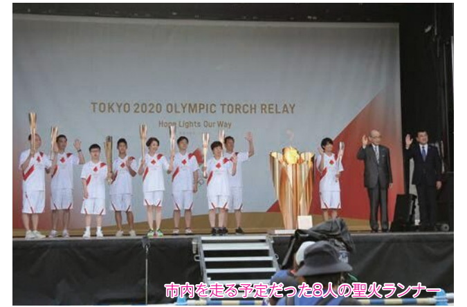
市内を走る予定だった 8 人の聖火ランナー

1 日目の金沢城公園では、野々市市を走る予定だった 8 人を含む 104 人の聖火ランナーがトーチキスを行い、最終ランナーとしてオリンピックの松本薫さんが聖火皿に聖火を灯しました。また、2 日目は湯っ足りパーク(七尾市)で 79 人の聖火ランナーがトーチキスを行いました。参加した聖火ランナーは「公道を走れなくなったのは残念だが、トーチキスの場だけでも用意してもらえて本当によかった」と喜んでいました。聖火は東京 2020 オリンピックの象徴として、日本全国をつないだのち、最終地点の東京都をめざします。