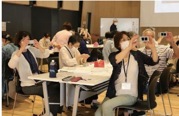
グループで教え合いながら実験する様子がとても楽しそうでした。

また、今年は苗植えに併せて、児童から新型コロナウイルスワクチン接種に携わる医療従事者に宛てた感謝や励ましのメッセージカードを作成しました。