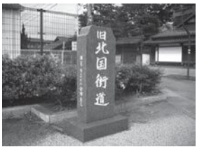
本町通りの角にたつ石碑

現在の本町通りを通る旧北国街道は、本町二丁目南交差点で南から西に向かって大きく直角に曲がっています。街道というと、まっすぐな一本道をイメージする人も多いと思いますが、なぜ野々市は宿場の中で直角に折れ曲がっているのでしょうか。