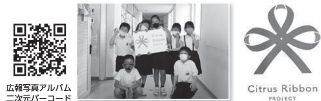
広報写真アルバム 二次元バーコード

今月の表紙は、御園小学校3年4組の7人に協力してもらいました。手に持つのは「シトラスリボンプロジェクト」のシンボル。愛媛県から始まり全国に広がっている取り組みで、新型コロナウイルス感染症に感染した人や、医療従事者などへの差別や誹謗中傷の防止を呼びかける活動です。シトラス色のリボンの三つの輪は「地域・家庭・職場（学校）」を示しています。たとえ感染してしまっても優しく迎える、思いやりあるまちを目指して野々市市もシトラスリボンプロジェクト運動に賛同しています。