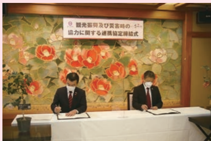
締結式の様子(11月18日(木)・花つばきにて)

市と山中温泉の旅館「花つばき」を運営するLink加賀株式会社は、観光振興と災害時の協力に関する連携協定を締結しました。ツバキを活用した観光誘客での連携に加え、災害時の協力も予定しており、大規模な災害が発生した際に、市民の予備避難所や入浴施設として、遠方からの災害ボランティアなどの受け入れ先として、旅館を開放していただきます。