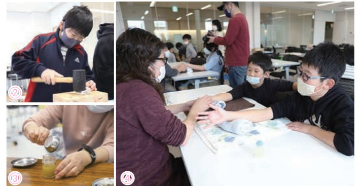
①親子で力を合わせて回します②種を力いっぱい叩く！③みんなで250gの種を搾ってやっと小瓶1つ分の量④ツバキ油でハンドマッサージ