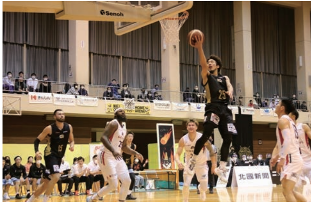
1月8日(土)、9日(日)にも市民体育館で公式戦を開催します！