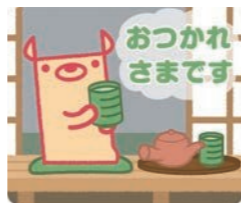
「動くのっティ」の一例

無料通話アプリ「LINE(ライン)」のクリエイターズスタンプでのっティのスタンプを販売しています。全64種類のかわいいのっティが楽しめます。ぜひ使ってみてね!