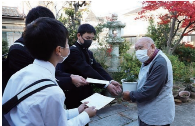
民生委員と共に訪問し、寒さに強いピオラなどを贈りました。

布水中学校生徒会は市社会福祉協議会と協力し、校区に住む一人暮らしのお年寄りへの鉢植え配布を一昨年から継続して行っています。11月19日(金)、ボランティア生徒約330人がグループ毎にお年寄りの家を訪問し、鉢植えとメッセージカードを贈りました。鉢植えは、布水中学校PTAの花育成活動と連携し、生徒たちが事前に準備したもの。生徒は緊張しながらも元気に「風邪を引かないように気をつけてください」と声かけしながら花とメッセージを渡していました。