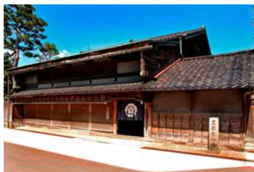
国指定重要文化財喜多家住宅