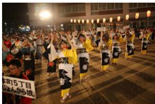
野々市じょんからまつり

観光 野々市じょんからまつり、花と緑ののいち椿まつり、豊年野菜神輿、虫送り（富奥地区、御経塚地区、押野地区） 国指定重要文化財喜多家住宅、郷土資料館 NoNo、史跡末松廃寺跡、ののいち椿館・椿山史跡御経塚遺跡・ふるさと歴史館