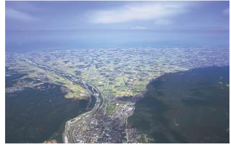
手取川扇状地航空写真