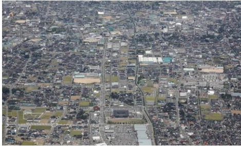
中心市街地航空写真