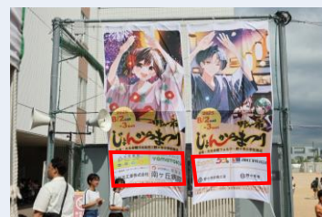
協賛B-1イメージ(グラウンド内)

※ステージは夜間に踊り大会・総踊りで使用します。 ※当日までは市役所屋外渡り廊下に設置されます。