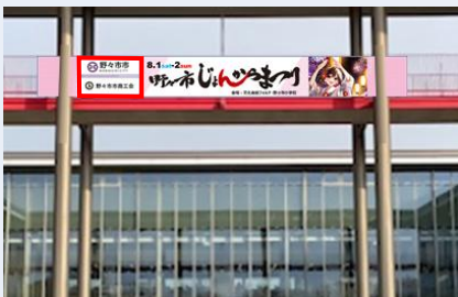
協賛Aイメージ (市役所屋外渡り廊下)