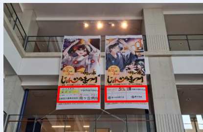
協賛B-1イメージ (市役所中央吹き抜け)