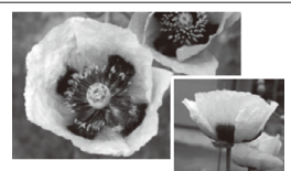
植えてはいけないケシ（アツミゲシ）

植えてはいけないケシを発見した場合は、県薬事衛生課または警察署に連絡してください。