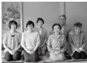
煎茶サークルの皆さん

季節ごとのお茶をいただきながら、礼儀作法を学んでいます。例えば、初春は昆布や梅の入ったおめでたい大福茶、節分には豆茶、ひな祭りにはあら茶。煎茶にも、すすり葉や玉露があり、夏は水で煎れる冷茶、秋には香り高く焙じて熱いお茶をたつぷりと…など、一年を通して美味しいお菓子とともに飽きることがありません。 日ごろの練習の成果として、3月の椿まつりと11月のマナビイフェスタでは文化会館フォルテに茶席を設け、毎年多くの人が足を運んでいます。日々の喧騒から離れた清々しく心豊かなひと時は私たちが快い場所へいざないます。興味のある人はぜひ見学に来てください。