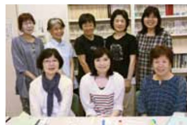
(上) おはなし会の準備中 (下) 押野公民館図書館ボランティアの皆さん

押野公民館で活動する図書館ボランティアの皆さんは現在9人。月2回、待合室で待つ子どもへの読み聞かせや、図書室の飾りつけ、子どもと一緒に1階ロビーに展示する本の入れ替えを行うなどしています。また季節に合わせて不定期におはなし会の開催も。何気なく見ている風景の中に、じつはボランティアの皆さんの工夫が光っています。