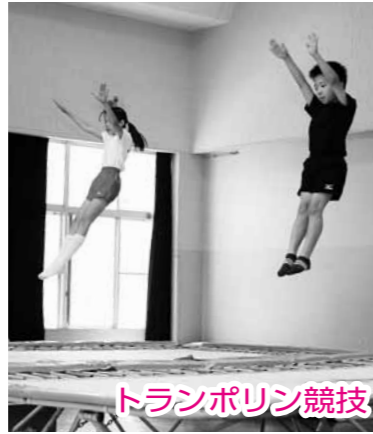
トランポリン競技