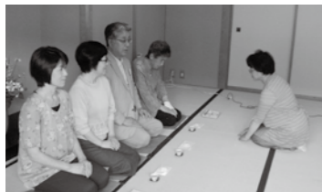
一煎、お召し上がりください。